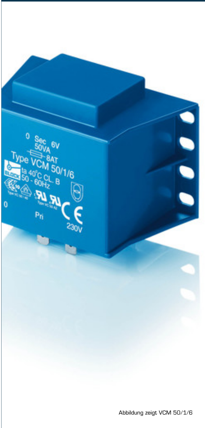
Abbildung zeigt VCM 50/1/6