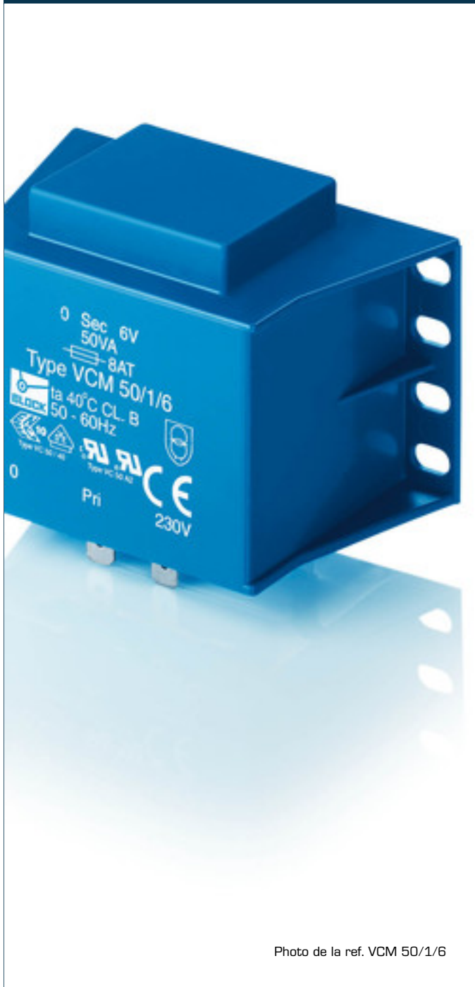
Photo de la ref. VCM 50/1/6