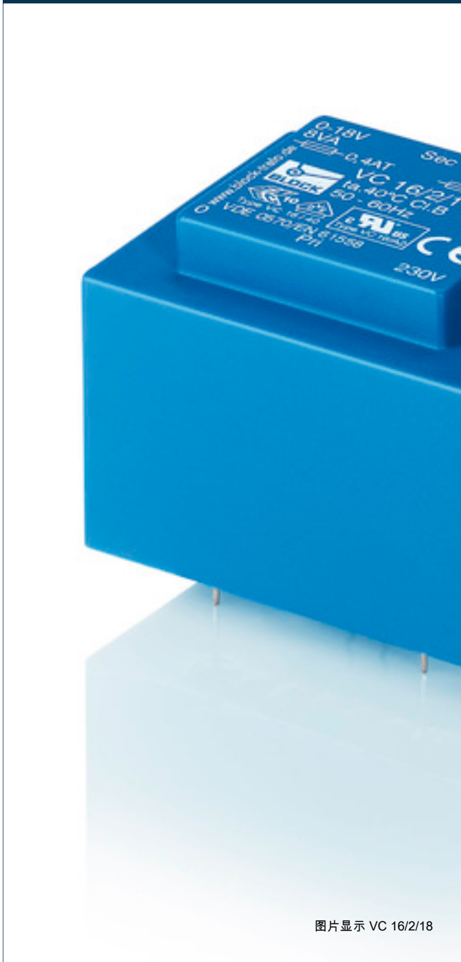
图片显示 VC 16/2/18