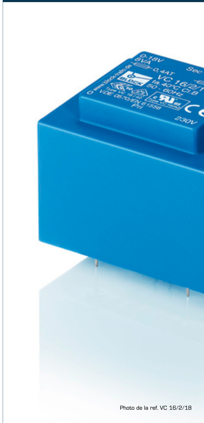
Photo de la ref. VC 16/2/18