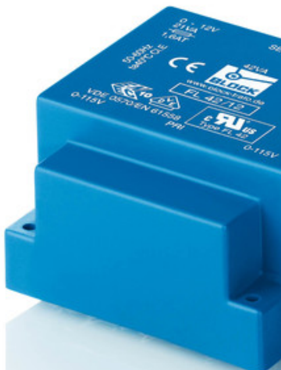
Photo de la ref. FL 42/12