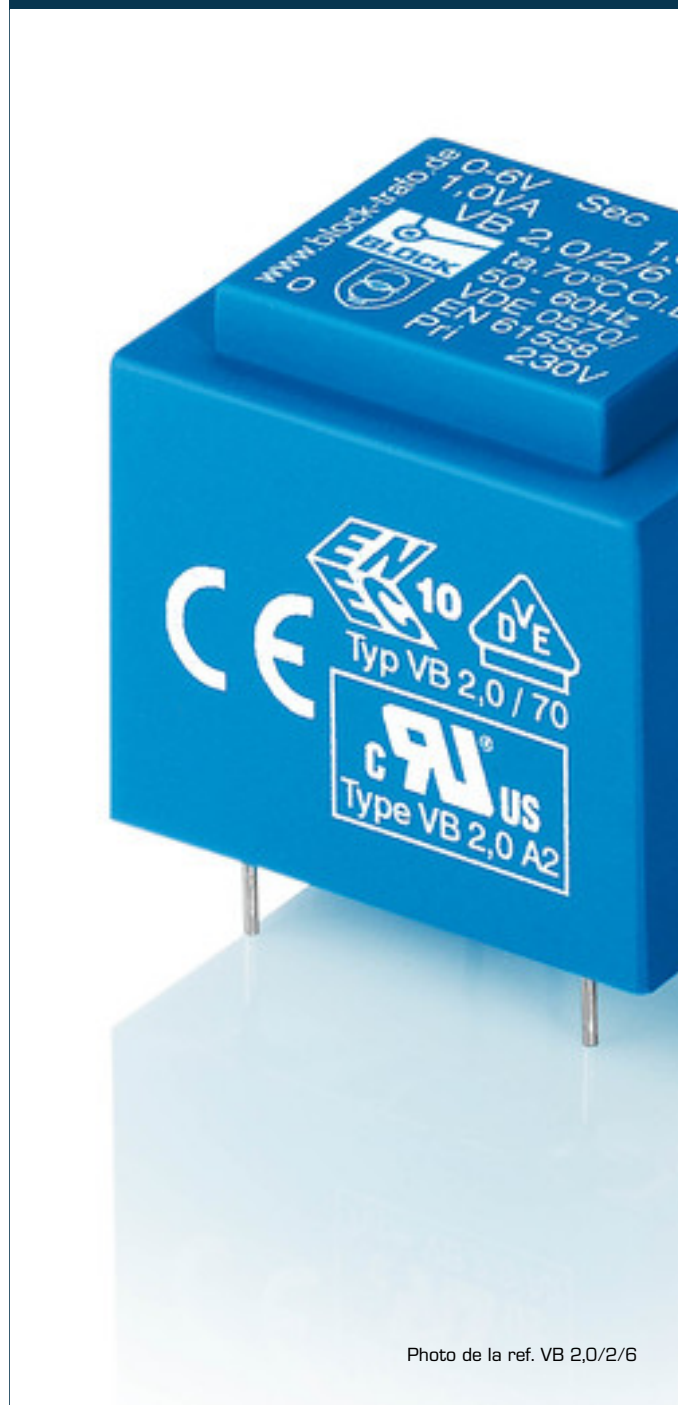
Photo de la ref. VB 2,0/2/6