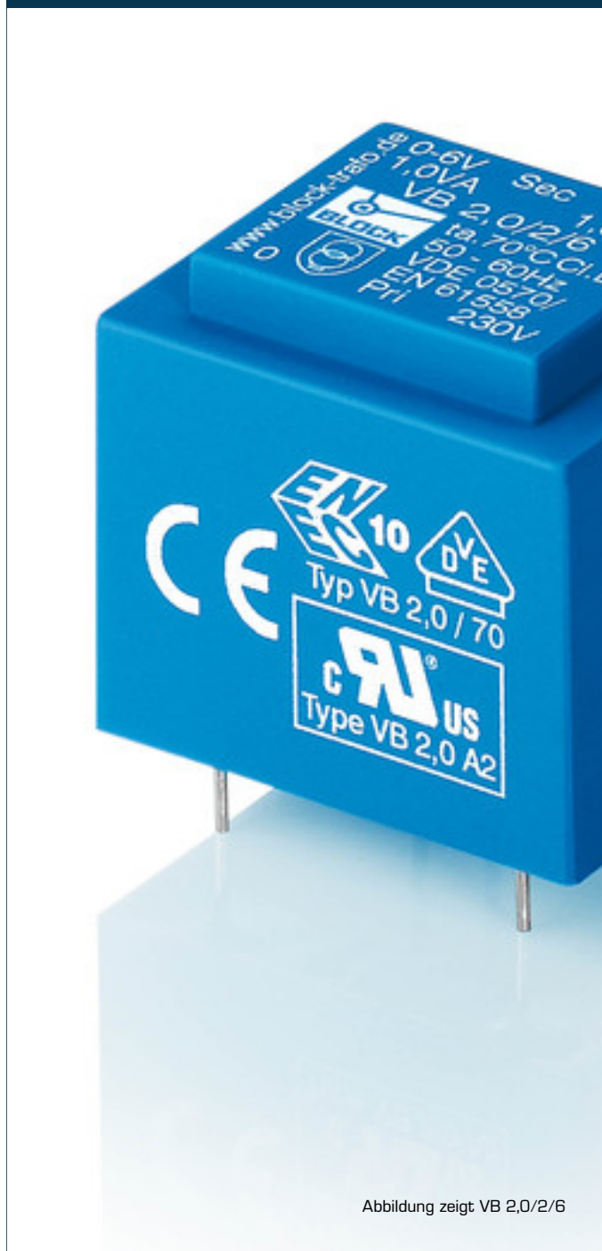
Abbildung zeigt VB 2,0/2/6