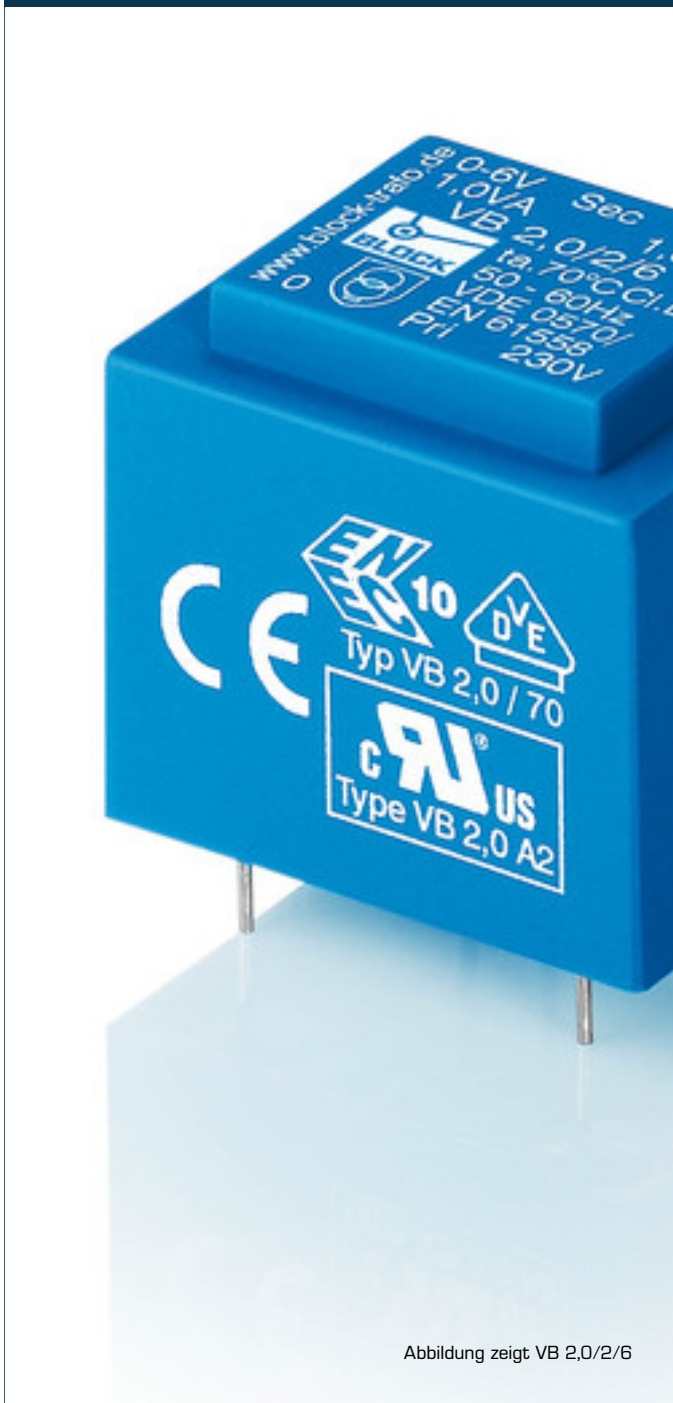
Abbildung zeigt VB 2,0/2/6