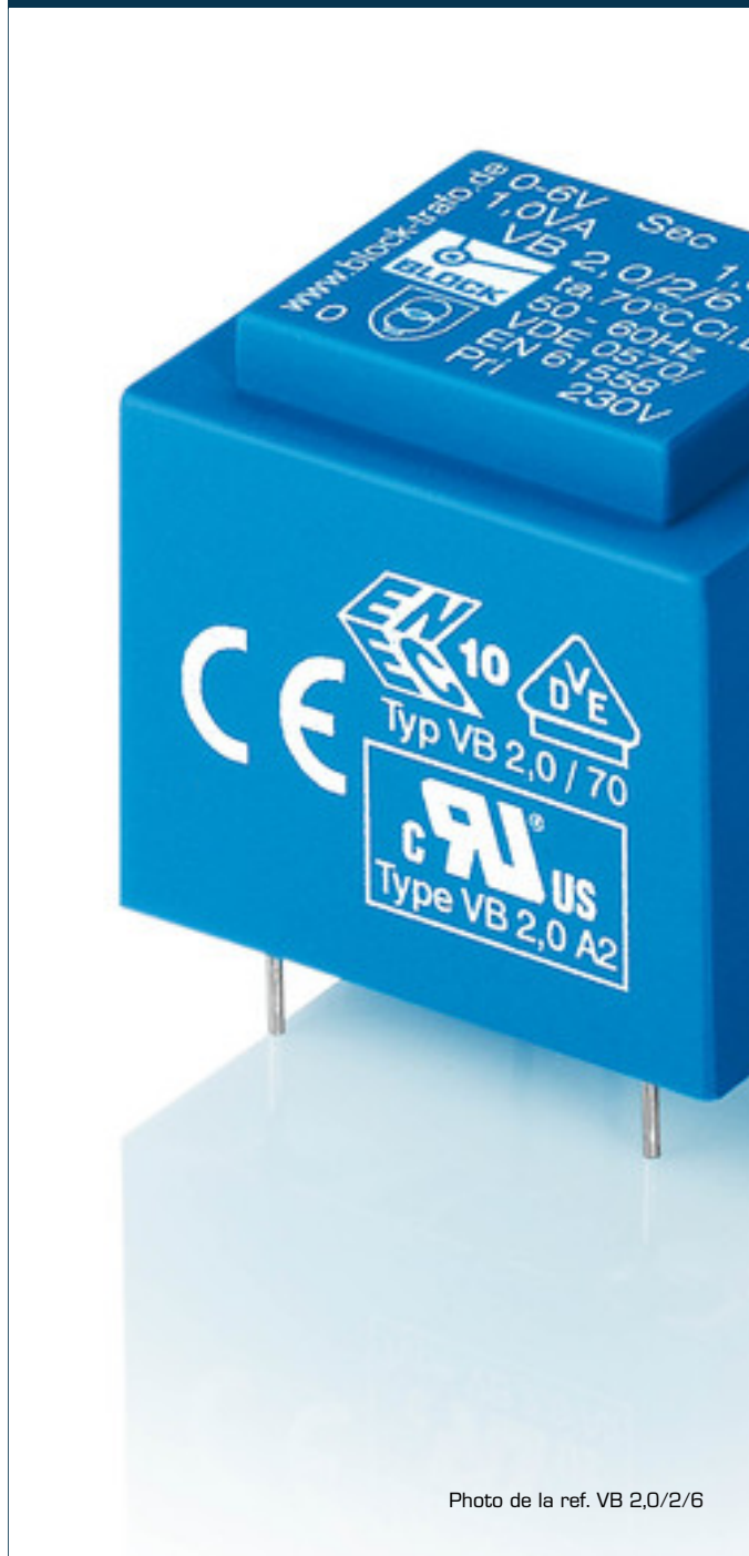
Photo de la ref. VB 2,0/2/6