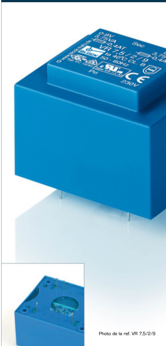
Photo de la ref. VR 7,5/2/9