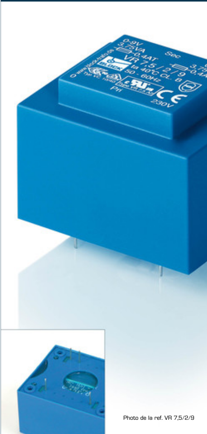
Photo de la ref. VR 7,5/2/9