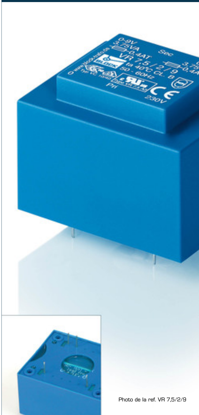
Photo de la ref. VR 7,5/2/9