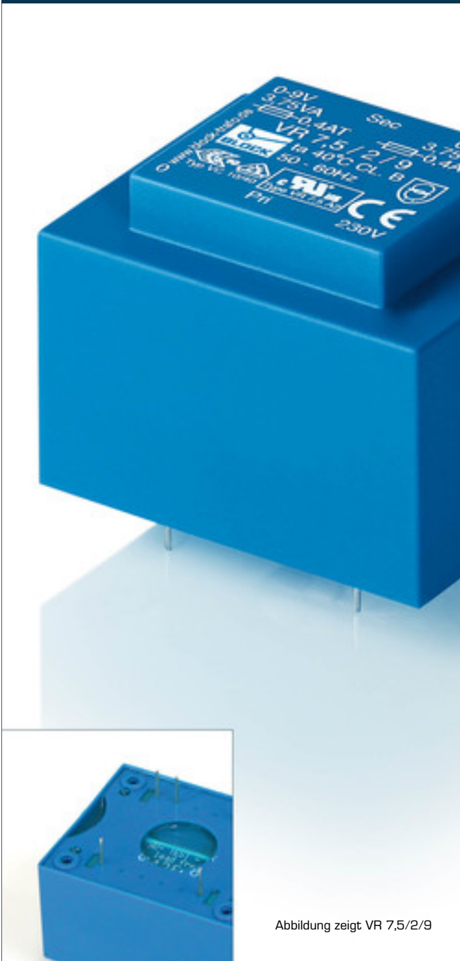
Abbildung zeigt VR 7,5/2/9