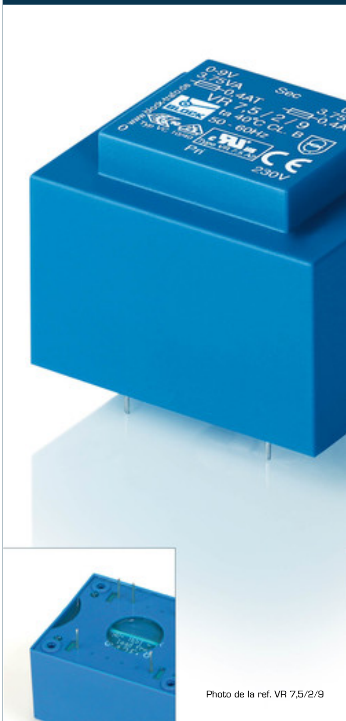
Photo de la ref. VR 7,5/2/9