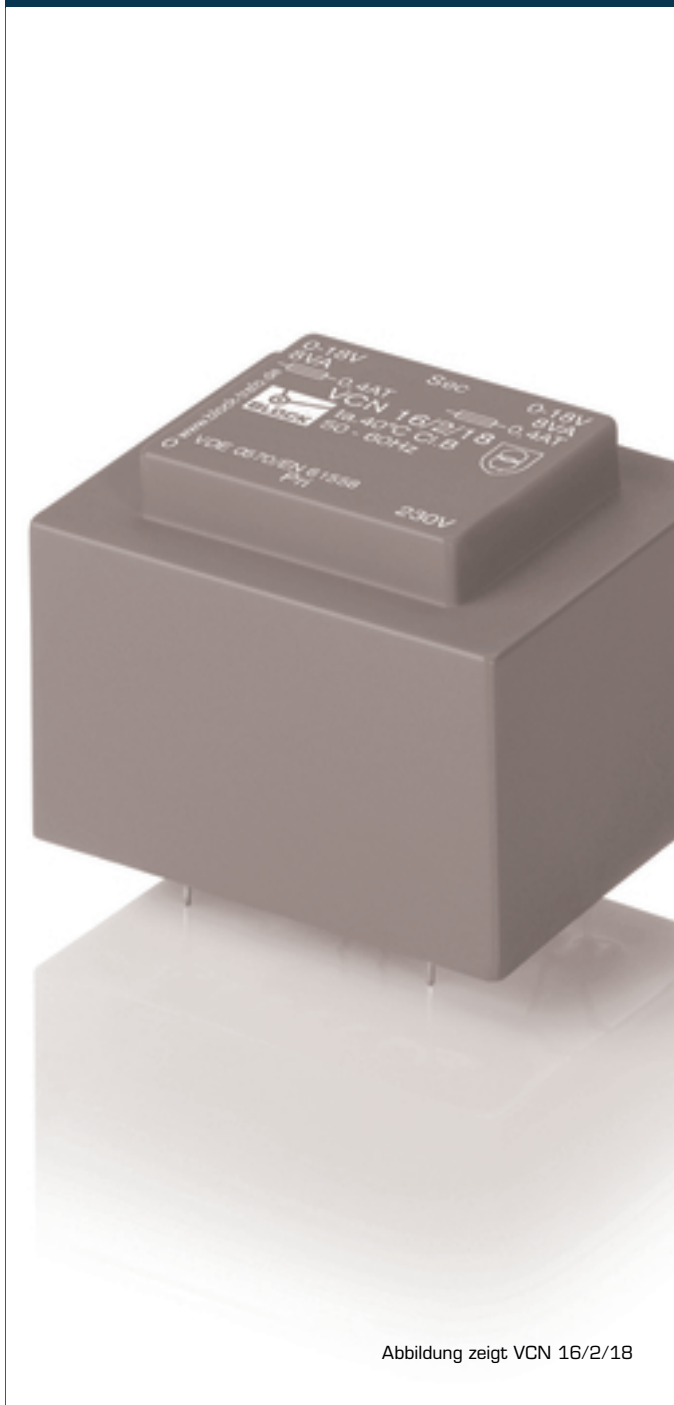
Abbildung zeigt VCN 16/2/18