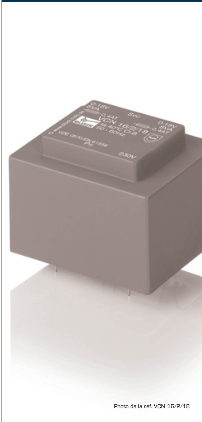
Photo de la ref. VCN 16/2/18