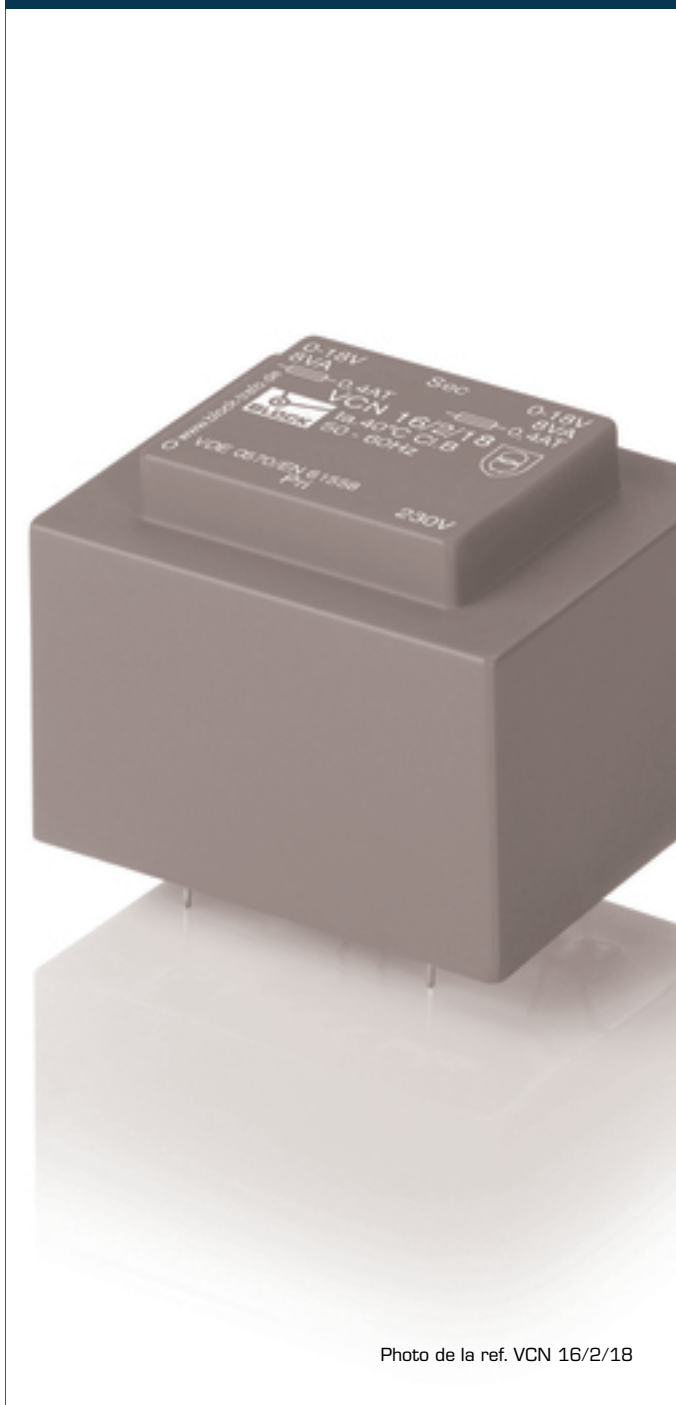
Photo de la ref. VCN 16/2/18