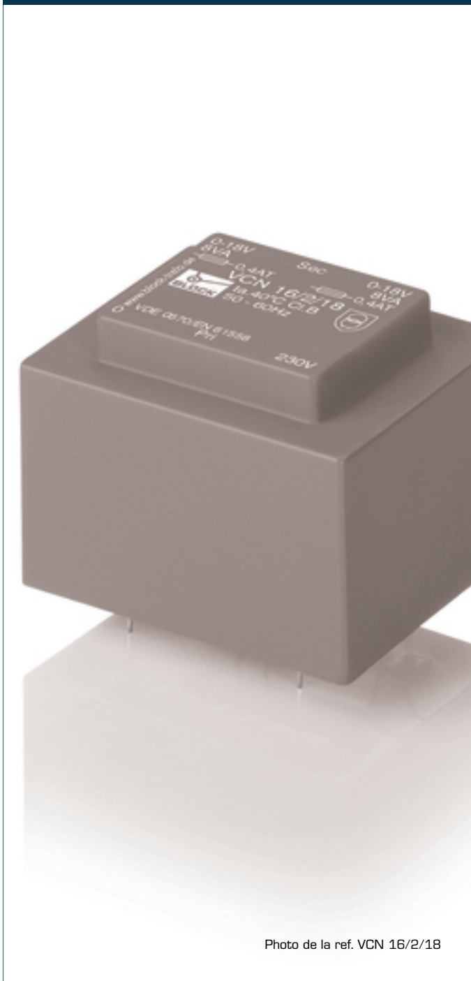
Photo de la ref. VCN 16/2/18