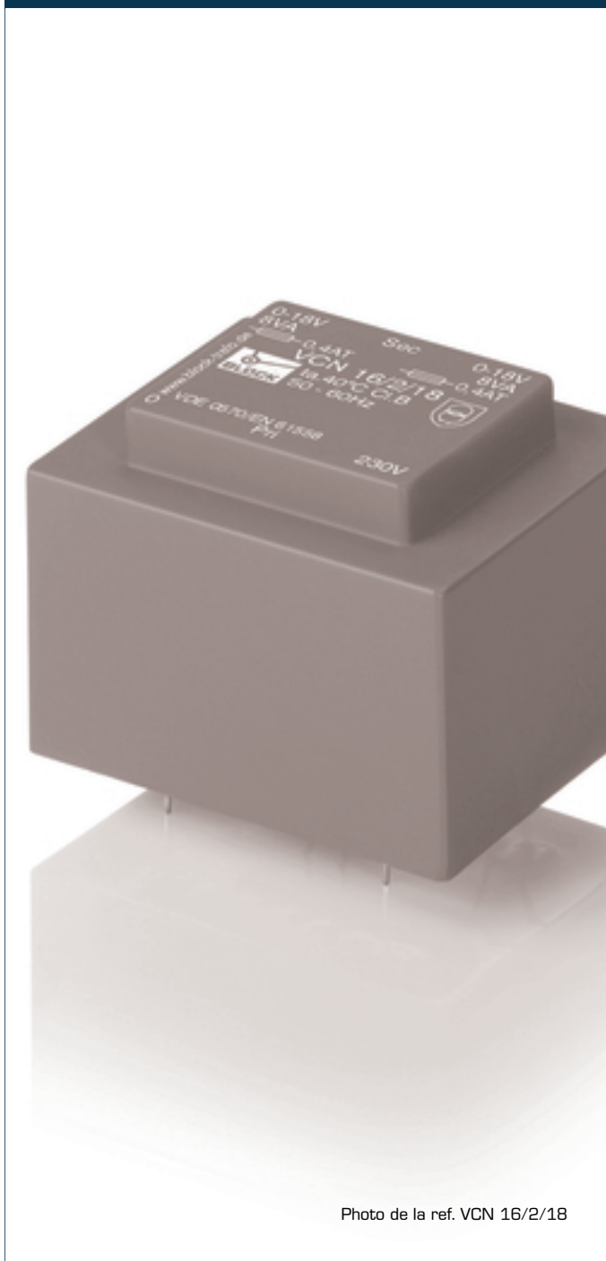
Photo de la ref. VCN 16/2/18