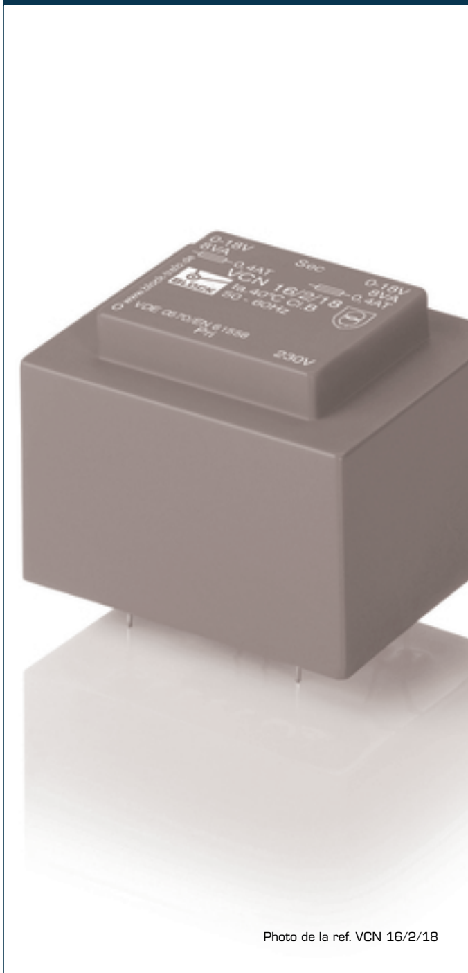
Photo de la ref. VCN 16/2/18