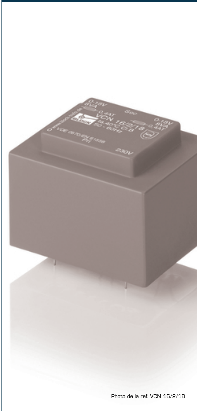
Photo de la ref. VCN 16/2/18