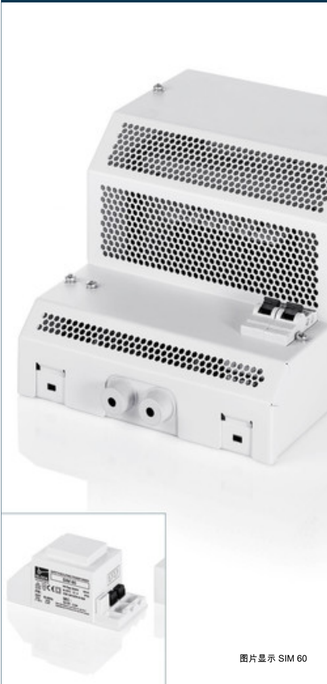
图片显示 SIM 60