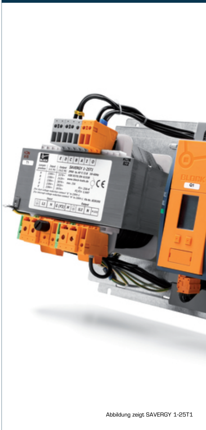
Abbildung zeigt SAVERGY 1-25T1