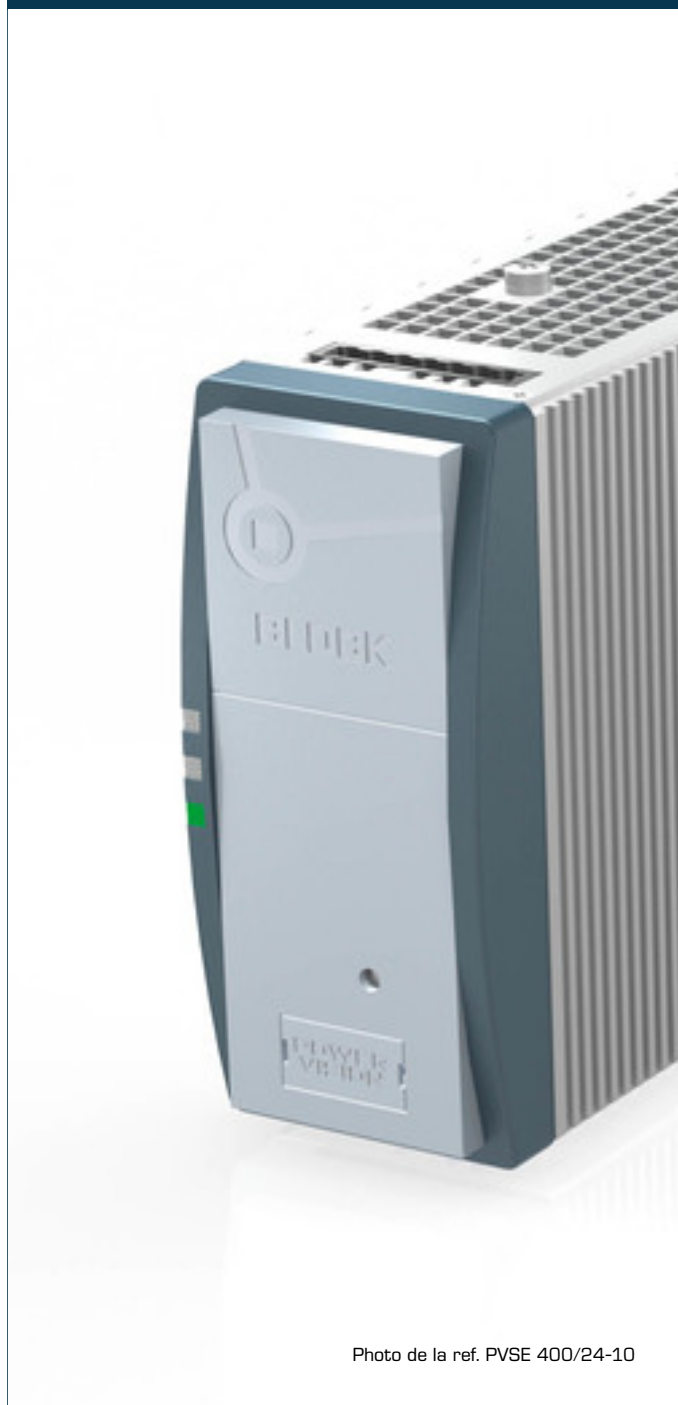
Photo de la ref. PVSE 400/24-10