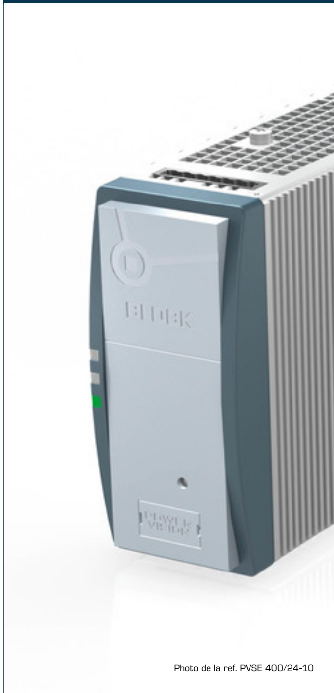
Photo de la ref. PVSE 400/24-10