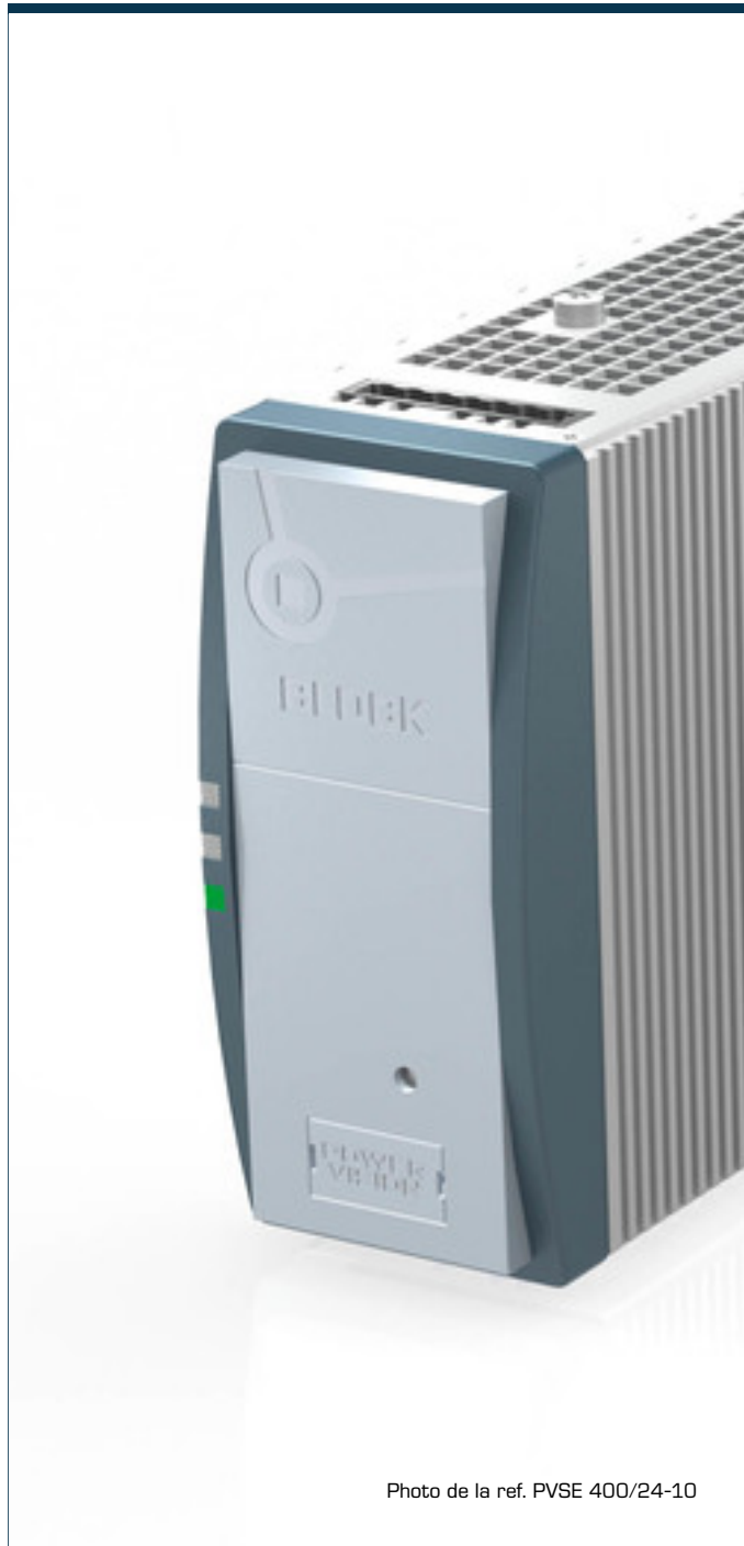
Photo de la ref. PVSE 400/24-10