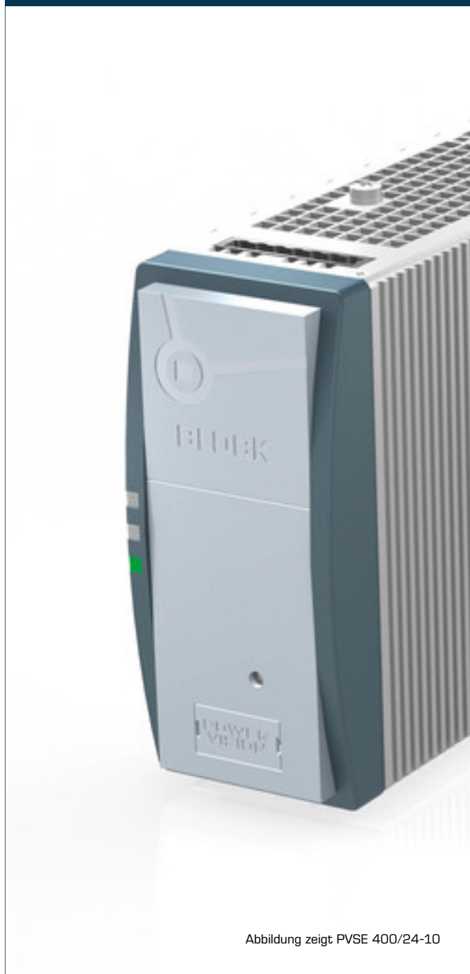
Abbildung zeigt PVSE 400/24-10