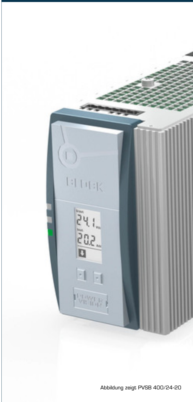
Abbildung zeigt PVSB 400/24-20