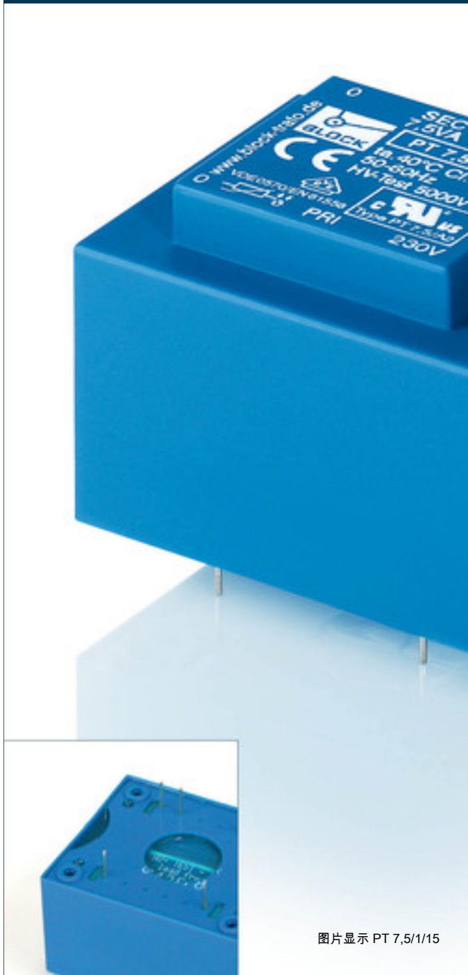
图片显示 PT 7,5/1/15