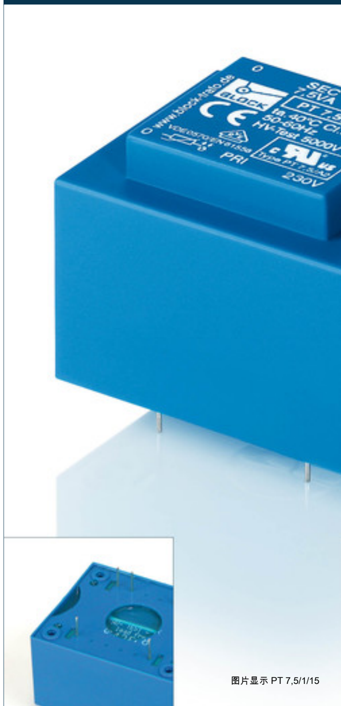
图片显示 PT 7,5/1/15