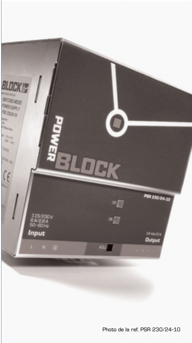
Photo de la ref. PSR 230/24-10

Alimentation à découpage primaire axé sur les tâches principales de l'alimentation en tension et en courant.