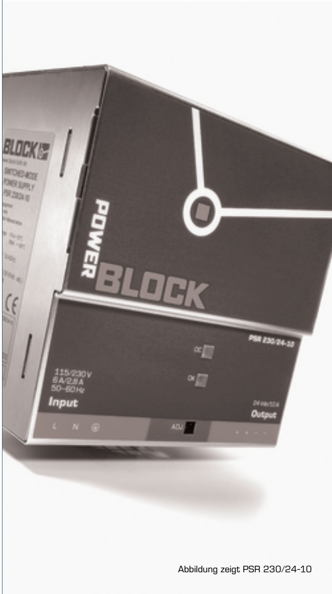
Abbildung zeigt PSR 230/24-10

Primär getaktetes Schaltnetzteil konzentriert auf die Kernaufgabe Spannungs- und Stromlieferung.