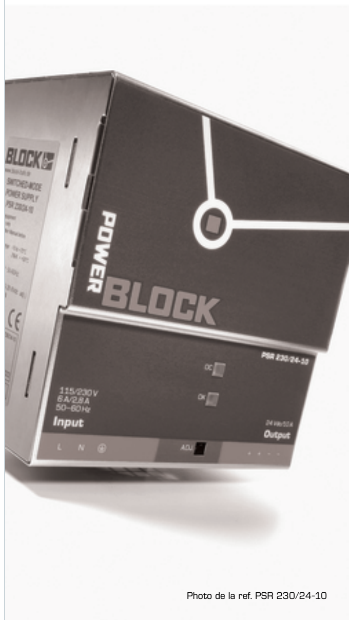
Photo de la ref. PSR 230/24-10

Alimentation à découpage primaire axé sur les tâches principales de l'alimentation en tension et en courant.