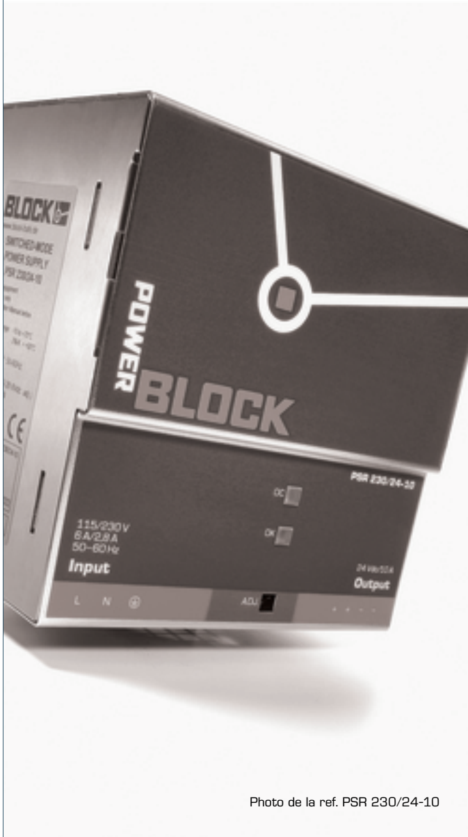
Photo de la ref. PSR 230/24-10

Alimentation à découpage primaire axé sur les tâches principales de l'alimentation en tension et en courant.