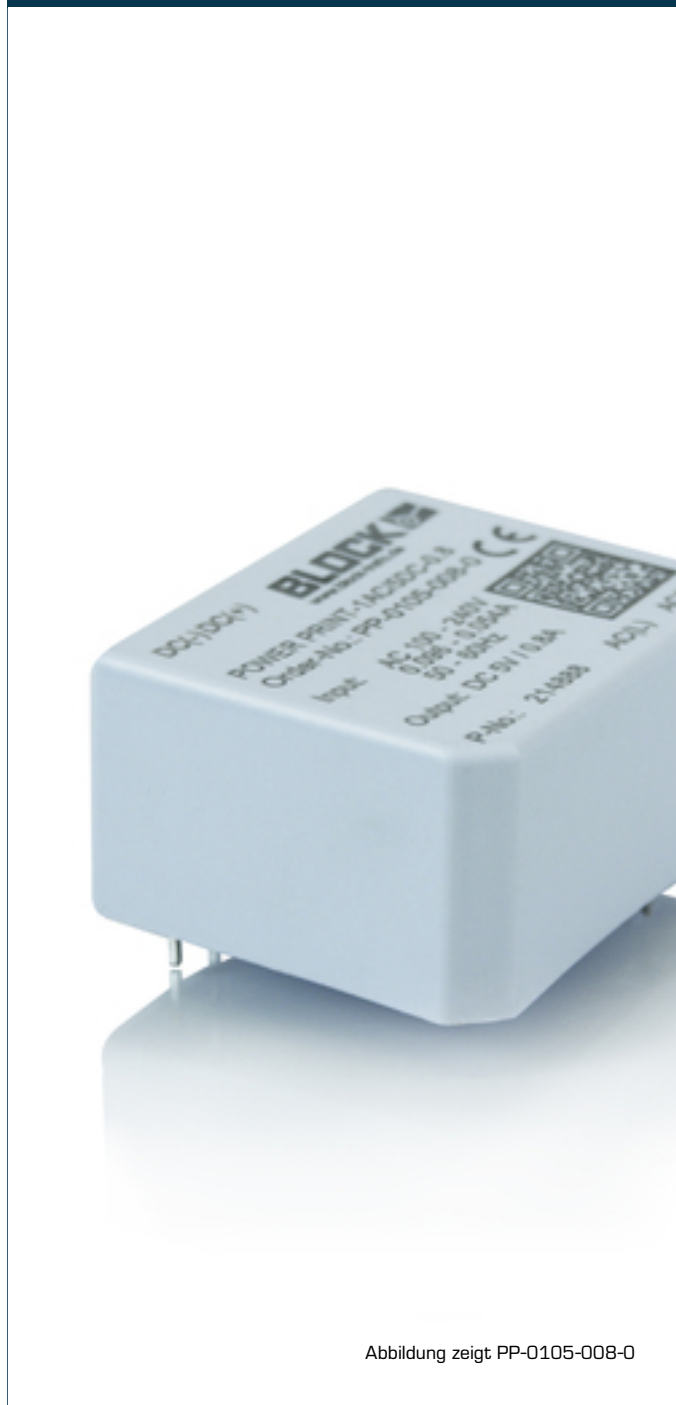
Abbildung zeigt PP-0105-008-0