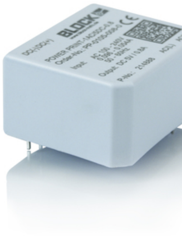
Photo de la ref. PP-0105-008-0

Alimentation avec un excellent rendement et de faibles pertes à vide, à souder directement sur la plaque. Permet un gain de place pour diverses applications.