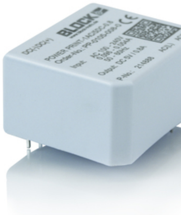
Abbildung zeigt PP-0105-008-0

Schaltnetzteil mit hervorragendem Wirkungsgrad und geringen Leerlaufverlusten, zur direkten Verlotung auf der Platine. Ermöglicht einen extrem platzsparenden Aufbau diverser Applikationen.