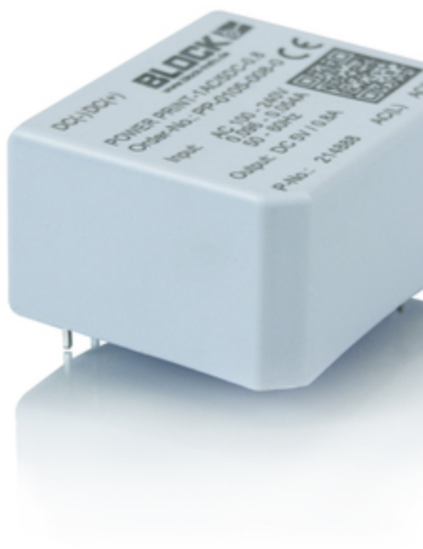
Photo de la ref. PP-0105-008-0