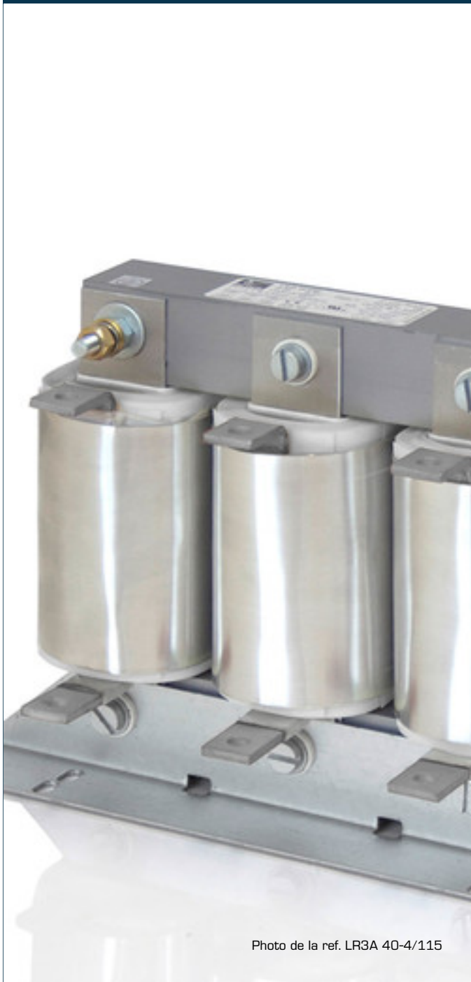
Photo de la ref. LR3A 40-4/115