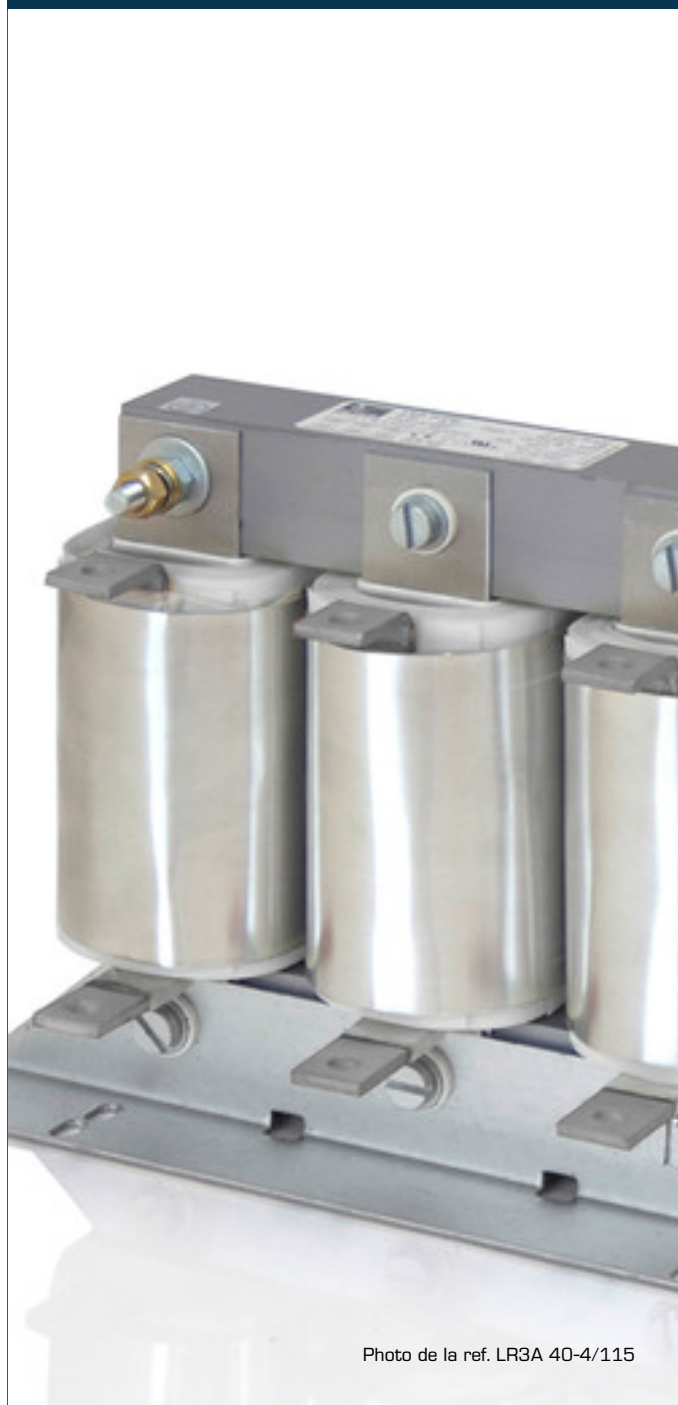
Photo de la ref. LR3A 40-4/115