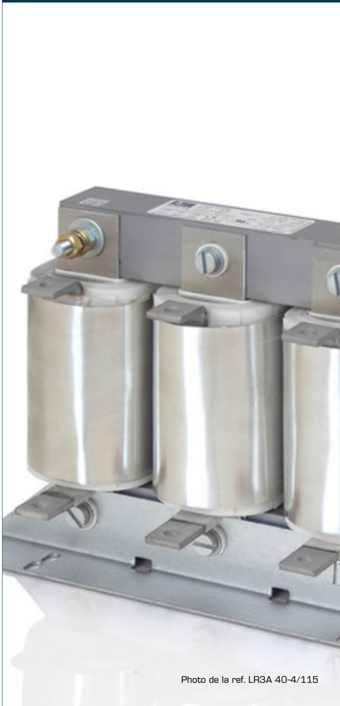
Photo de la ref. LR3A 40-4/115