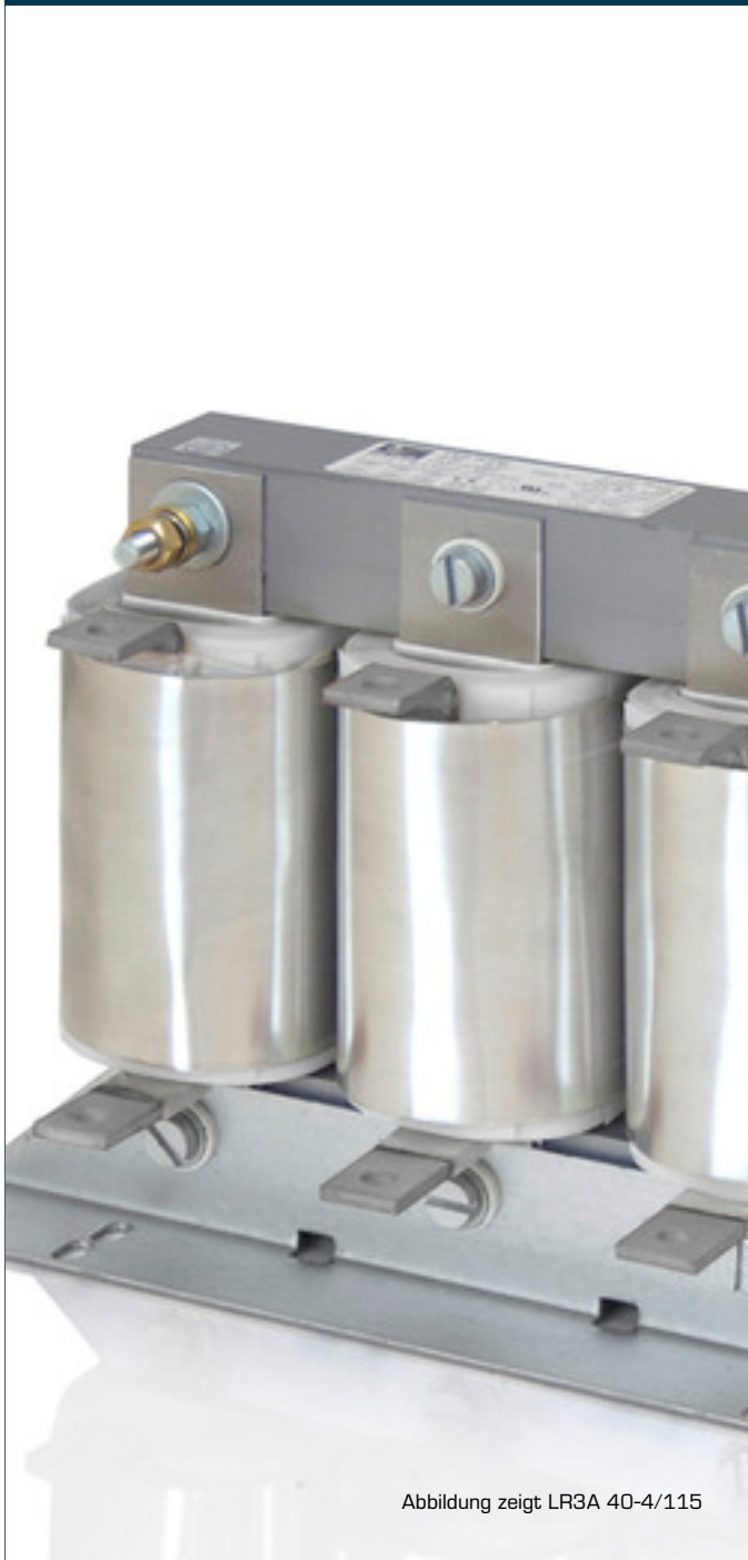
Abbildung zeigt LR3A 40-4/115