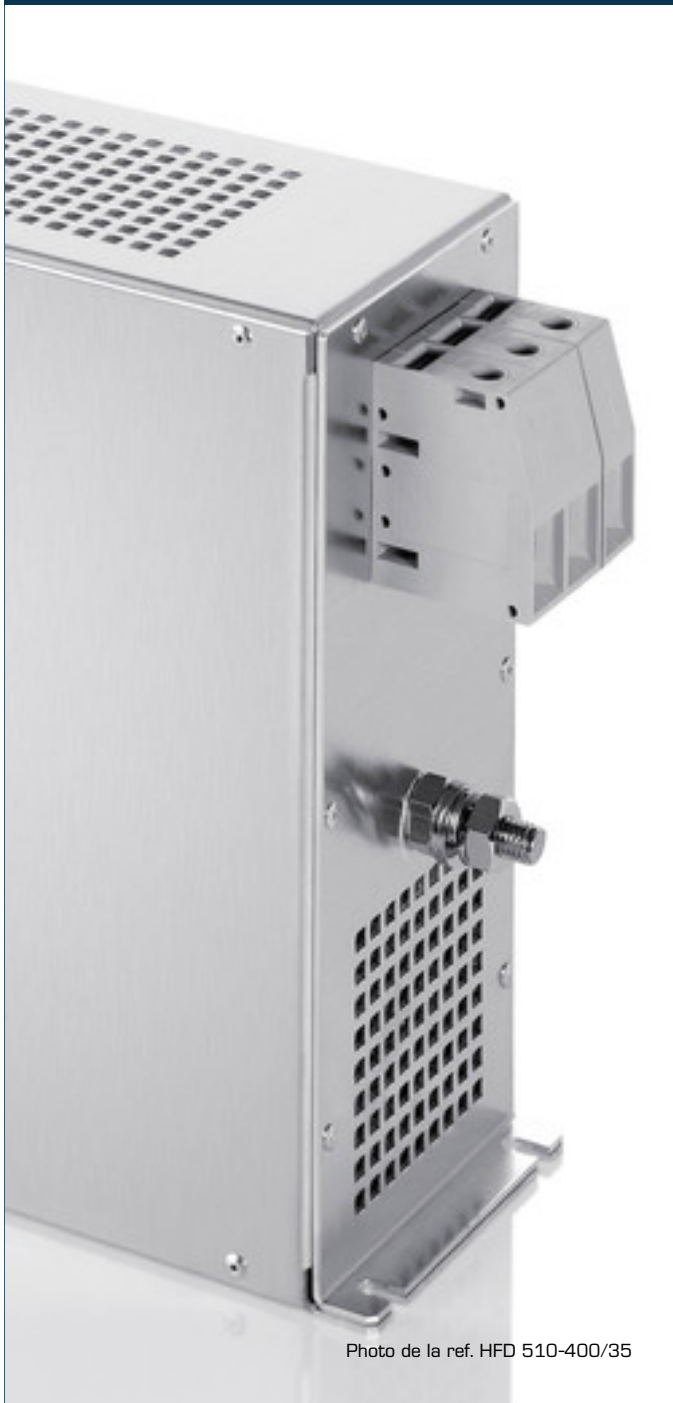
Photo de la ref. HFD 510-400/35