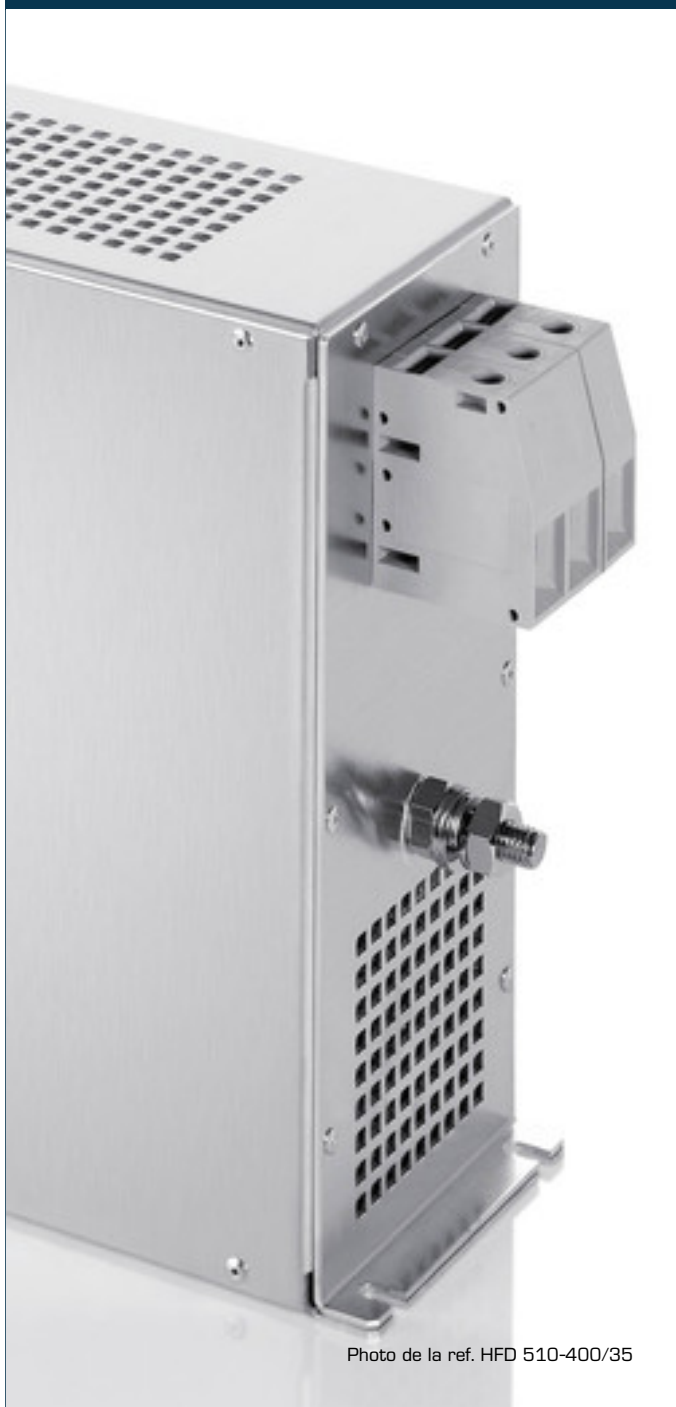
Photo de la ref. HFD 510-400/35