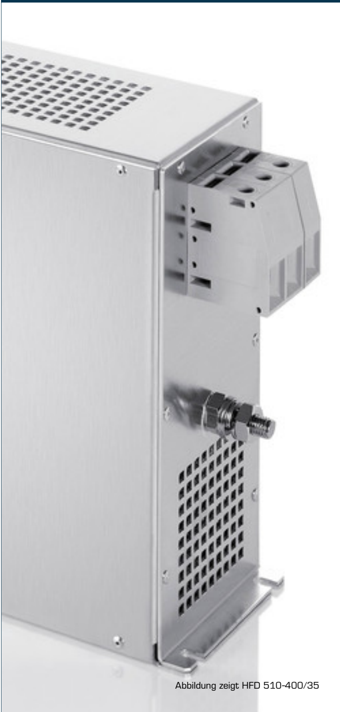
Abbildung zeigt HFD 510-400/35