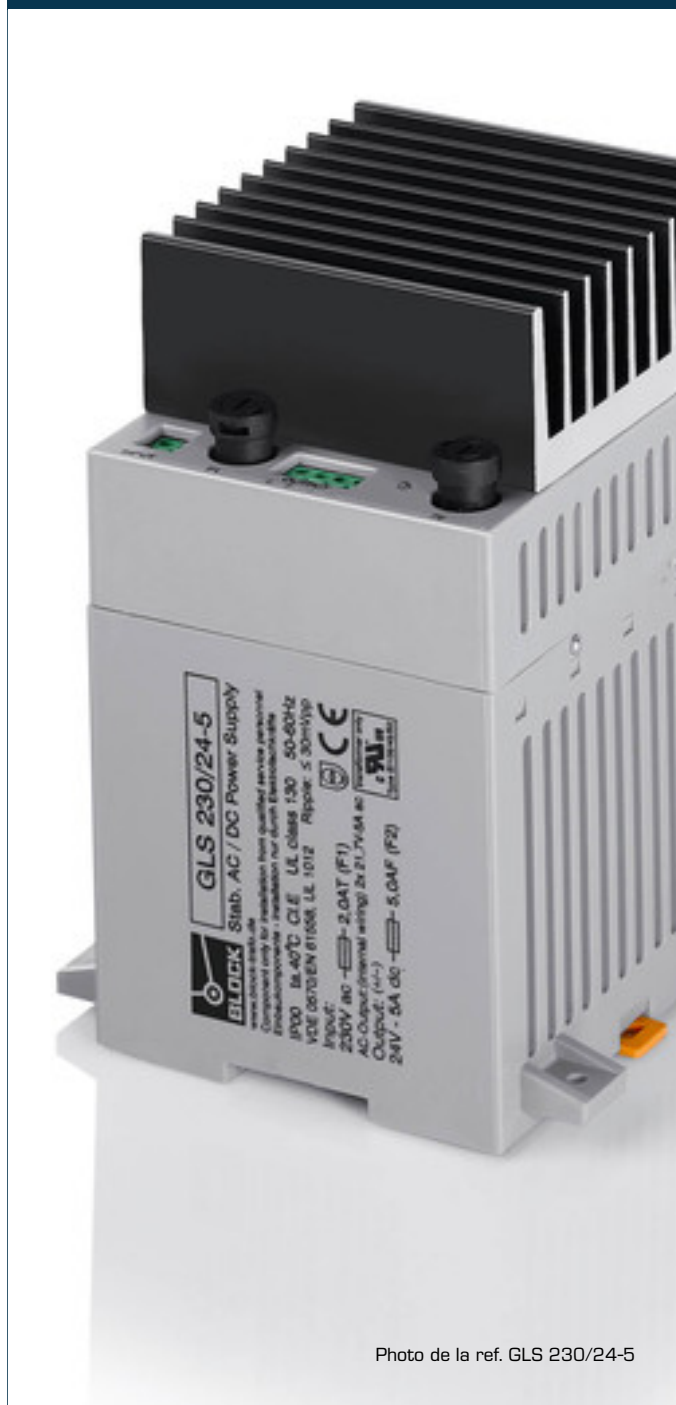
Photo de la ref. GLS 230/24-5