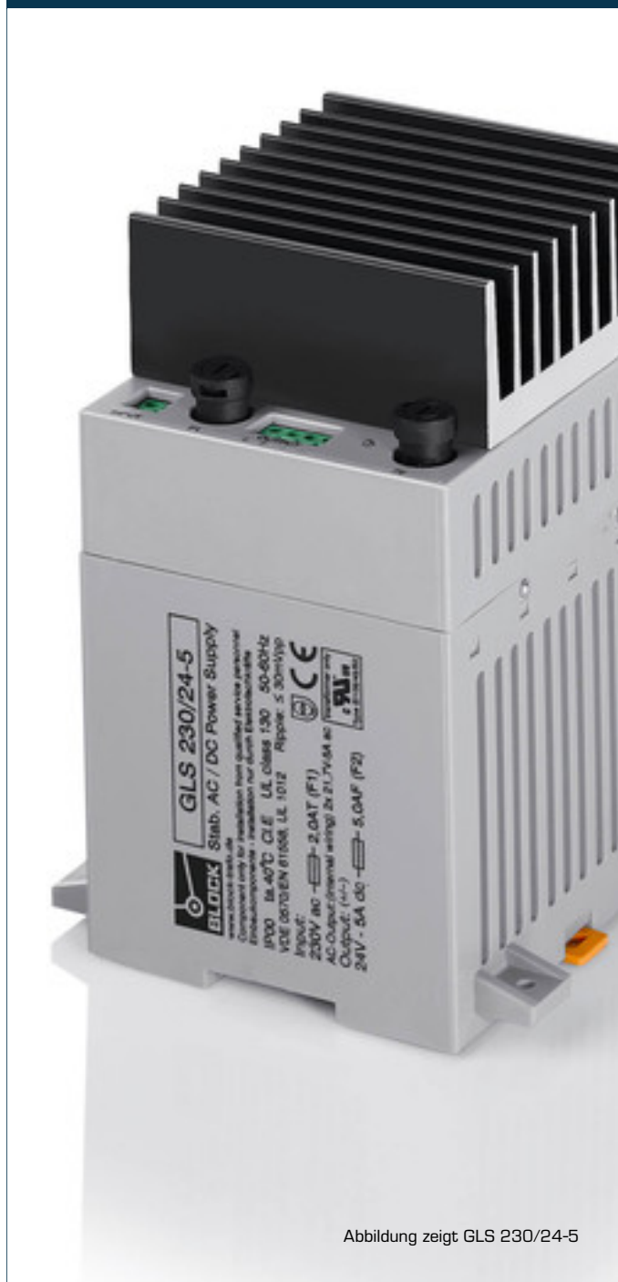
Abbildung zeigt GLS 230/24-5