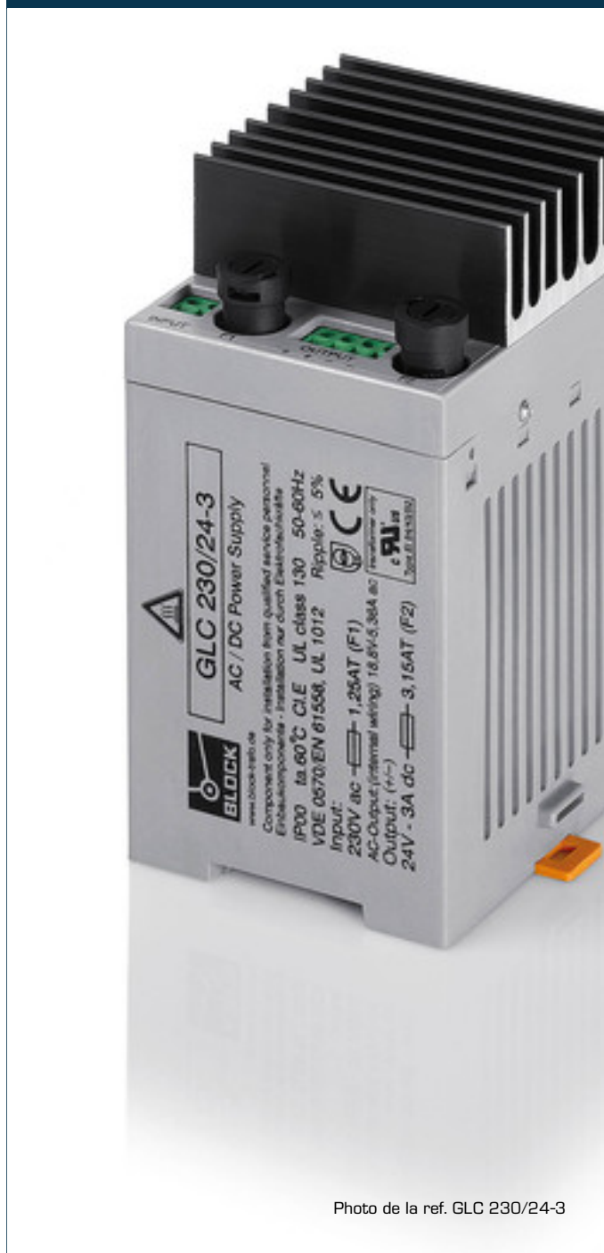
Photo de la ref. GLC 230/24-3