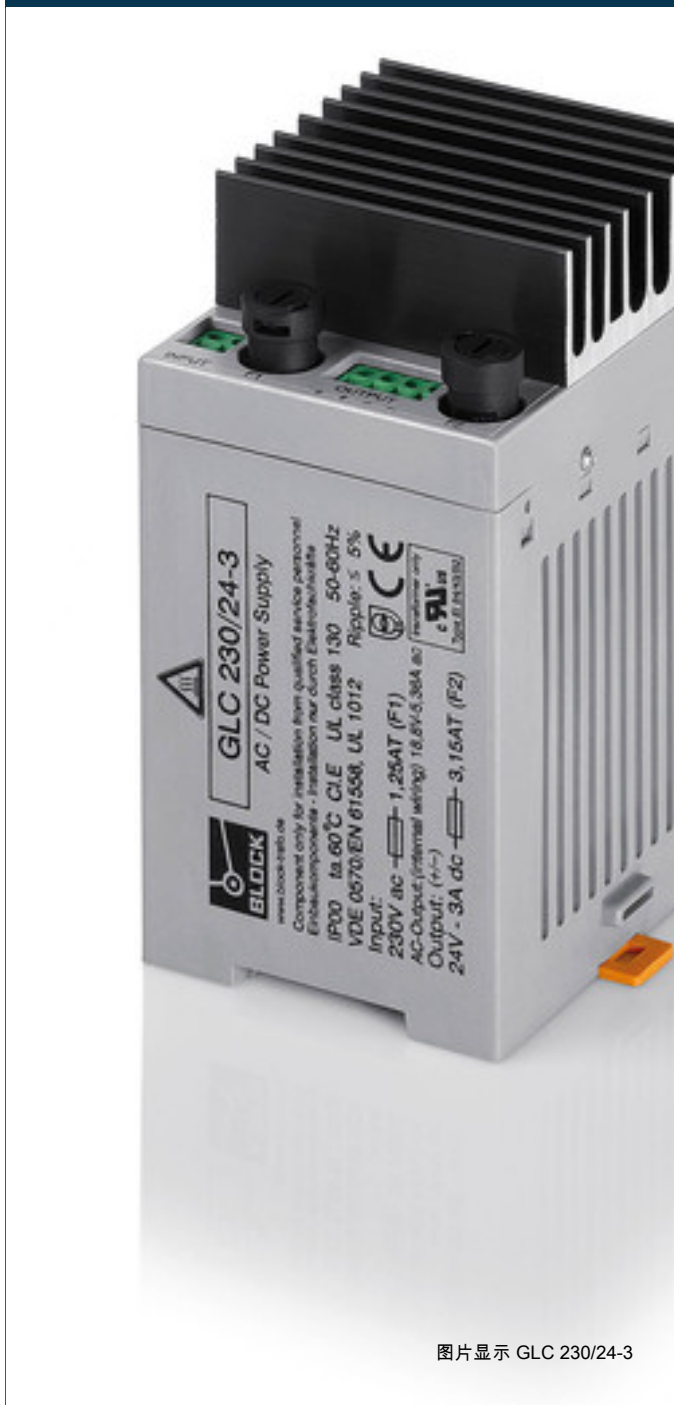
图片显示 GLC 230/24-3