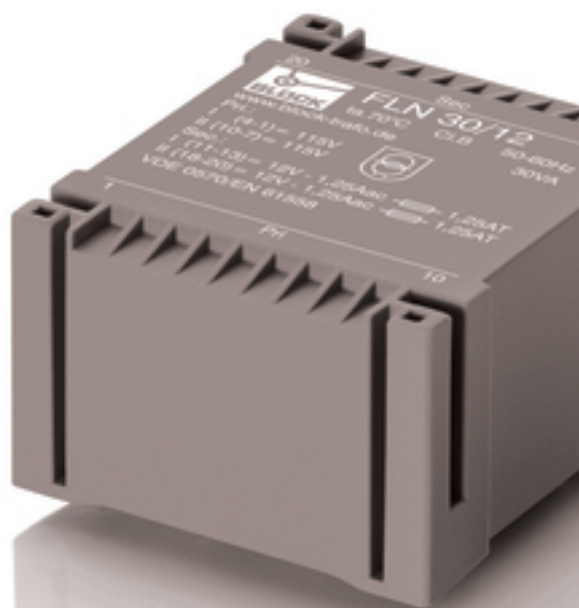
Photo de la ref. FLN 30/12